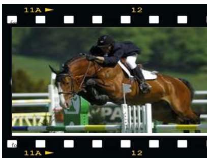
Du 19 au 22 août, le jumping international de Mâcon a eu lieu au Centre equestre. Ce fut une réussite pour le rayonnement de la ville et de l'équitation