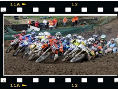
Les Championnats du Monde Junior de moto à Gueugnon les 21 et 22 août 2010