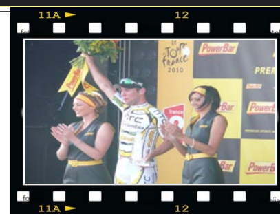
Invité à Gueugnon pour l'arrivée du Tour de France, le président du CDOS de Saône-et-Loire a ramené de beaux souvenirs